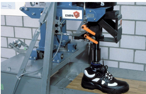
Abbildung 1 Wuppertaler Boden- und Schuhtester BST 2000

Für den Schuhbereich werden die geprüften Bodenbeläge in die Bewertungsgruppen GS 1 bis GS 4 und für den Barfussbereich in GB 1 bis GB 3 eingeteilt, wobei die Klassifizierungen GS 4 resp. GB 3 die grösste Rutschhemmung bedeuten (Abbildung 2, S. 12).