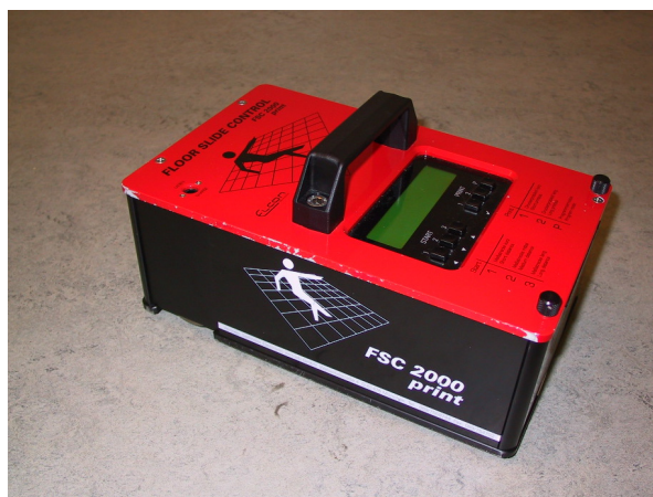
Abbildung 5 Messung am Bauwerk mit einem mobilen Gleitmessgerät

Wo konsistente gleitfördernde Stoffe anfallen, reicht eine ebene rutschhemmende Oberfläche allein nicht mehr aus. Es muss unter der Gehebene ein zusätzlicher Verdrängungsraum in Form von Vertiefungen geschaffen werden. Solche Böden werden mit V-Kennzahlen klassifiziert, die das erforderliche Mindestverdrängungsvolumen in \text{cm}^3/\text{dm}^2 angeben. Die Klassierungen gehen von V 4 ( 4 \text{ cm}^3 pro \text{dm}^2 ) bis V 10 ( 10 \text{ cm}^3 pro \text{dm}^2 ). Die Ermittlung des Volumens des Verdrängungsraums erfolgt nach dem festgelegten Verfahren gemäss DIN 51130. Weitere Hinweise sind in der bfu-Fachdokumentation 2.027 «Bodenbeläge» zu finden.