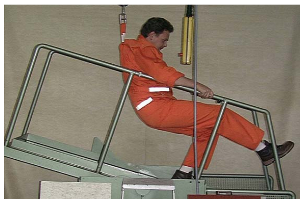
Abbildung 4 Begehungsverfahren (Schiefe Ebene)

Aufgrund der stark unterschiedlichen Messmethoden lassen sich die Bewertungsgruppen gemäss «bfu-Prüfreglement R 9729 – Klassifizierung von Bodenbelägen mit rutschhemmenden Eigenschaften» nicht mit den Bewertungsgruppen gemäss DIN 51130 und 51097 vergleichen. Während es sich bei Prüfungen gemäss bfu-Prüfreglement um apparative Reibungsmessungen handelt, basieren Bewertungen gemäss DIN-Normen auf Tests mit Probanden, die die Rutschhemmung im Rahmen von Begehungsversuchen auf der Schiefen Ebene subjektiv beurteilen. Hinzu kommen wesentliche Unterschiede in den Reibmaterialien und den verwendeten Zwischenmedien. Bei der Bewertung von Bodenbelägen für den Schuhbereich tragen die Probanden Sicherheitsschuhe und beurteilen die Rutschhemmung eines Belagsmusters im överschmutzten Zustand. Demgegenüber werden in den bfu-Prüfungen Reibungsmessungen mit vier verschiedenen Schuhen und mit zwei unterschiedlichen Zwischenmedien durchgeführt. Bei der Bewertung von Bodenbelägen im Nassbereich sind die Probanden barfuss, während die bfu-Klassierung auf Reibungsmessungen mit vier verschiedenen Schuhen sowie mit zwei unterschiedlichen Hautersatzmaterialien beruht. Als Zwischenmedium wird in